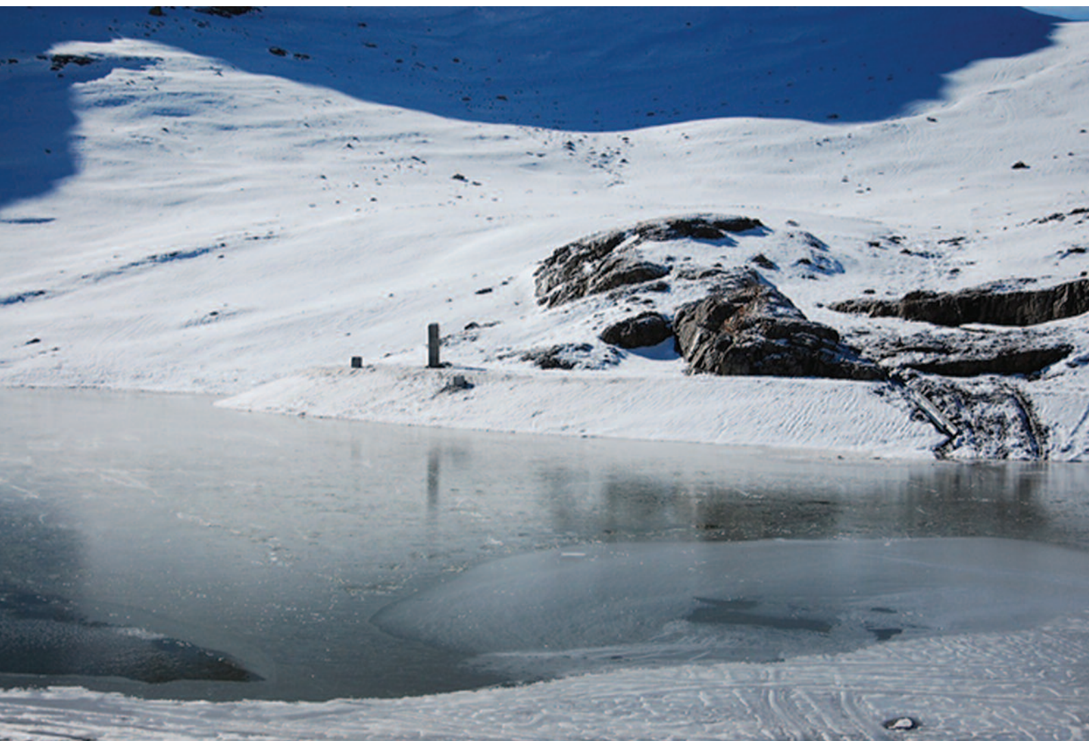
Situation au 24 octobre 2013