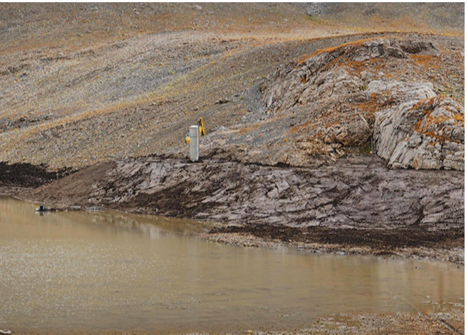
Digue des Grandes Gouilles

On a déjà pu constater une accumulation importante sur ce bassin naturel dès la fin des travaux, gage d'étanchéité. Ainsi, nous pouvons bénéficier de cette réserve supplémentaire.